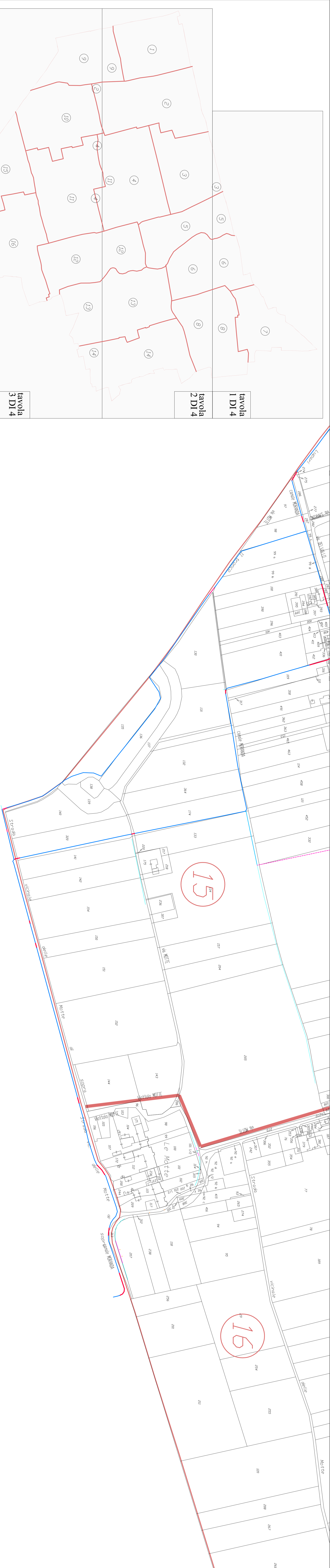
tavola 1 DI 4 tavola 2 DI 4 tavola 3 DI 4 tavola 4 DI 4